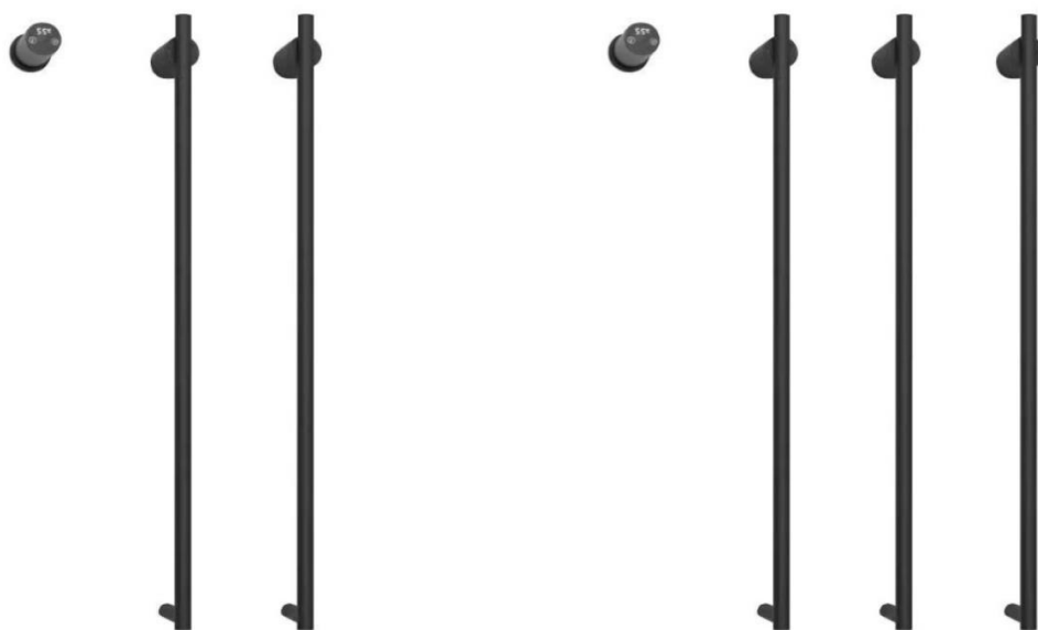
СХЕМА УСТАНОВКИ ЭЛЕКТРИЧЕСКОГО ПОЛОТЕНЦЕСУШИТЕЛЯ арт. PL-TRE07BR2, PL-TRE07BR3